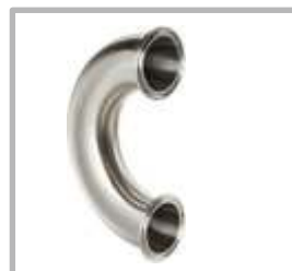
CODO 180° CLAMP