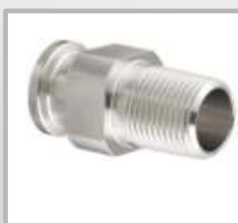
ADAPTADOR CLAMP X MACHO NPT