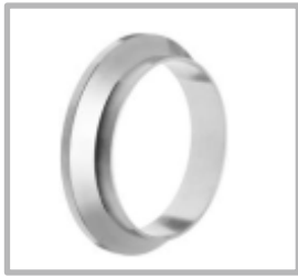
FERULA CORTA CLAMP