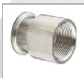
ADAPTADOR CLAMP X HEMBRA NPT