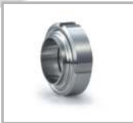
TUERCA UNION SMS