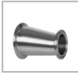
REDUCTOR EXCENTRICO CLAMP