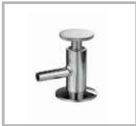
VALVULA DE MUESTREO CLAMP