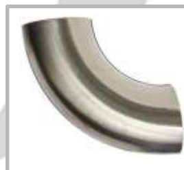
CODO 90° SOLDABLE