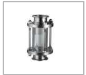
MIRILLA EN LINEA CLAMP