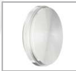
TAPON CONICO CLAMP