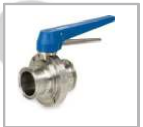
VALVULA MARIPOSA CLAMP DE GATILLO