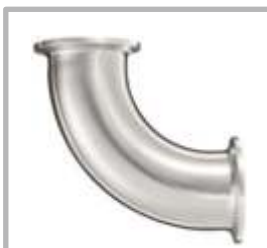
CODO 90° CLAMP