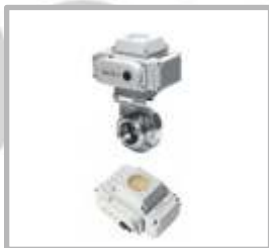
VALVULA MARIPOSA CON ACTUADOR ELECTRICO