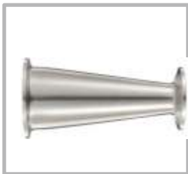
REDUCTOR CONCENTRICO CLAMP