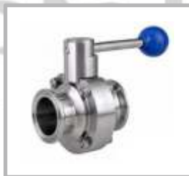
VALVULA MARIPOSA CLAMP DE TIRON