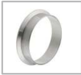
FERULA LARGA CLAMP