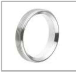
FERULA ROSCADA BEVELSEAT