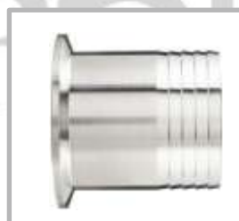
ESPIGA CLAMP GRANDE