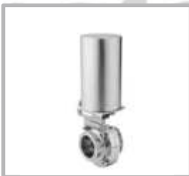
VALVULA MARIPOSA CON ACTUADOR NEUMATICO