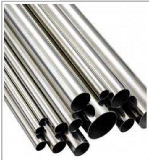
TUBERIA GRADO ALIMENTICIO INOXIDABLE