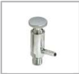
VALVULA DE MUESTREO ROSCADO