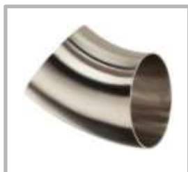
CODO 45° SOLDABLE