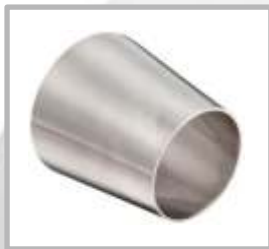
REDUCTOR CONCENTRICO SOLDABLE