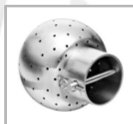
BOLA SANITARIA PARA LIMPIEZA