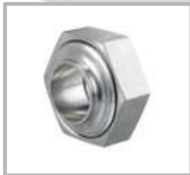
TUERCA UNION HEXAGONAL