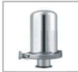
VALVULA RESPIRADOR CON FILTRO