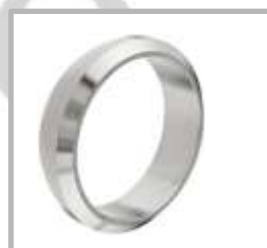
FERULA CONICA BEVELSEAT