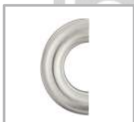
CODO 180° SOLDABLE