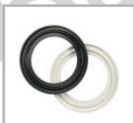
EMPAQUE EPDM Y TEFLON