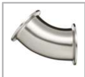
CODO 45° CLAMP