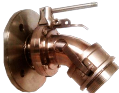
Adaptador para descargar la leche

Durable: Construcción sólida en acero inoxidable que requiere poco mantenimiento.